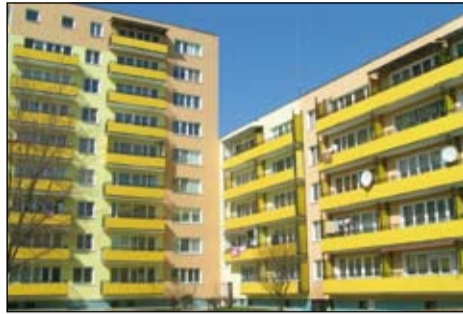
Fragment osiedla MSM Międzytorze, 2009