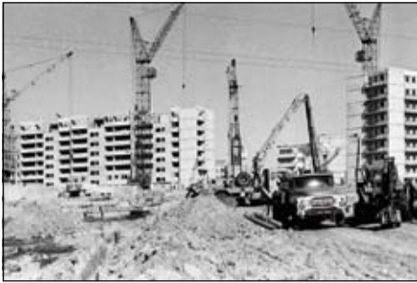
Budowa osiedla MSM Podolszyce Północ, 1984